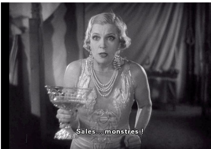
Sales... monstres !