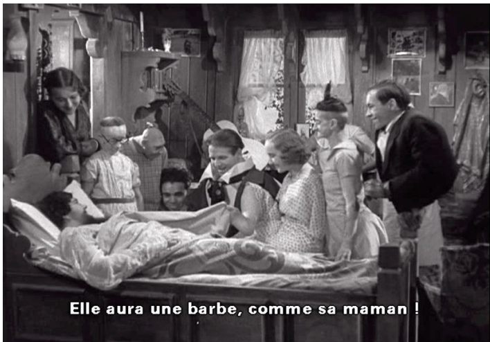
Elle aura une barbe, comme sa maman !