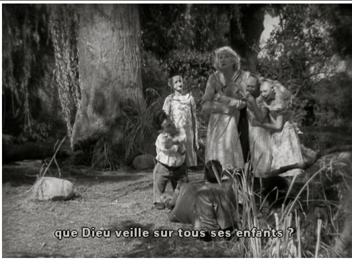
que Dieu veille sur tous ses enfants ?