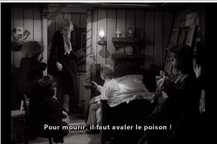
Pour mourir, il faut avaler le poison !